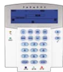
K37/K35 Clavier à ACL fixe sans fil/câblé pour 32 zones