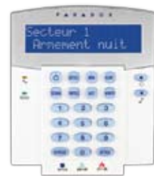
K32LCD Clavier à ACL de 32 caractères