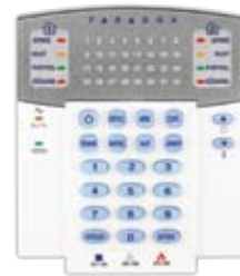
K32RF/K32 Clavier à DEL sans fil/câblé pour 32 zones