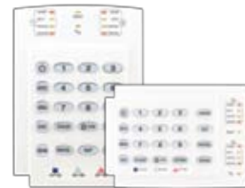
K10HV Clavier à DEL câblé pour 10 zones