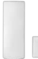
Contact de porte à longue portée (MG-DCT1)