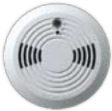
Détecteur de fumée (SD738) fabriqué par EVERday (Taiwan)†