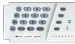
K636 Clavier à DEL câblé pour 10 zones