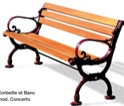
Corbeille et Banc mod. Concerto