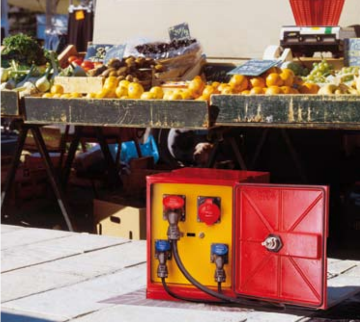
Borne escamotable pour la distribution d'énergie